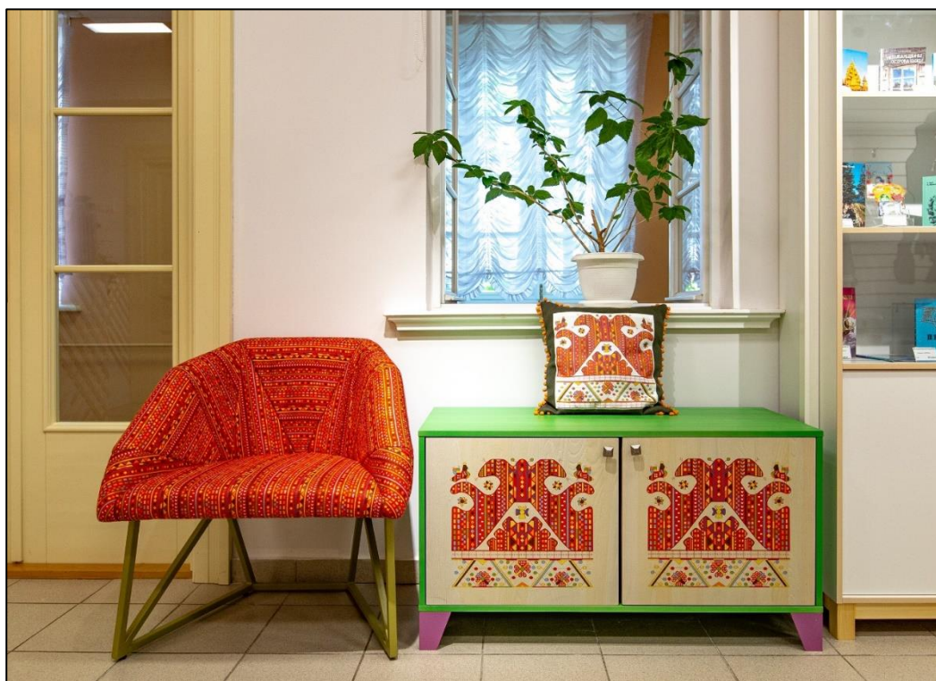
Фрагмент интерьера музейного магазина Национального музея Республики Карелия. Изделия, спроектированные и изготовленные дизайнером Яной Пермяковой.