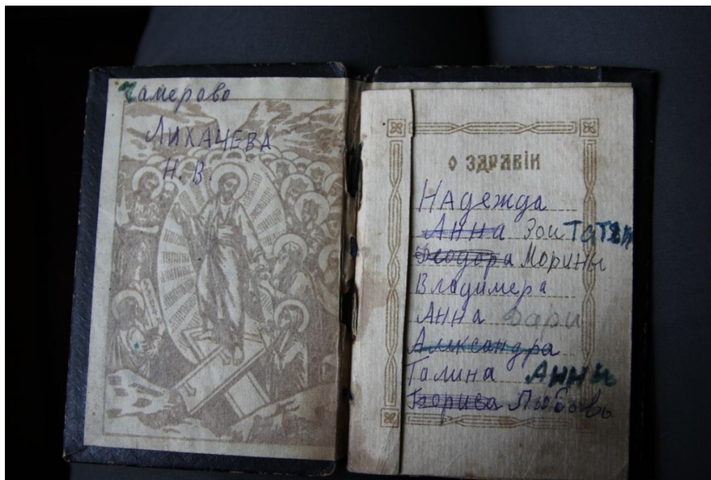
Фото 5. Помянник Н. В. Лихачевой. Село Чамерово Весьегонского р-на Тверской области. Карелы. Экспедиция РЭМ: Н. Н. Русанова, О. М. Фишман. 2011 г.